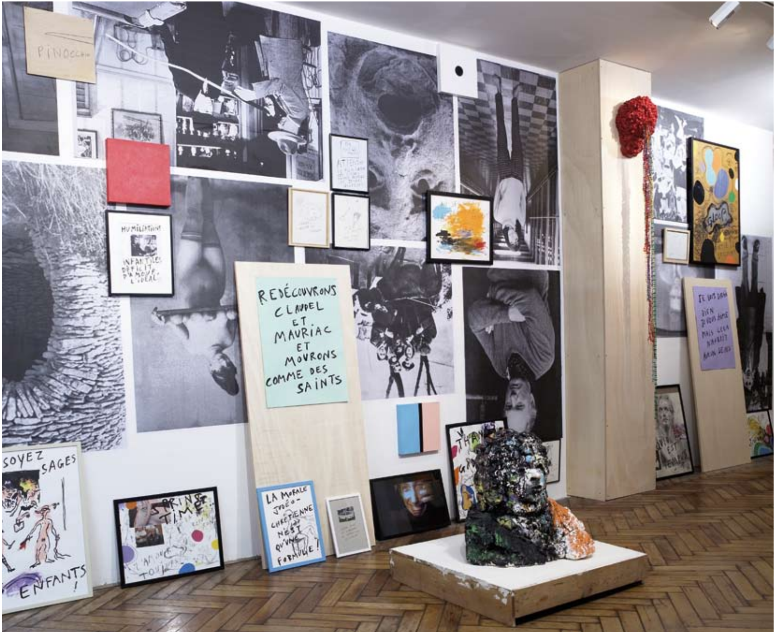
INSTALLATION: QUOI ENCORE UNE EXPOSITION? , 2008. Dessins, collages, peintures, sculptures, tirages jets d'encre... /Drawings, collages, paintings, sculptures, prints..., galerie Loevenbruck, Paris, 2008.