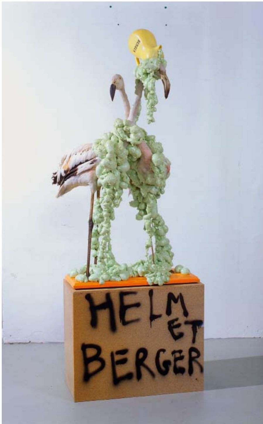
HELMET BERGER, 2002 Techniques mixtes/Mixed media. 168 x 70 x 62 cm.